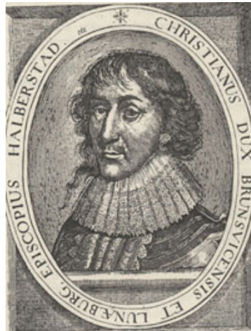
Christian de Brunswick

fatidique il demande à deux de ses soldats de l'aider à se lever, de lui attacher l'épée à sa ceinture et de le soutenir sous les aisselles, debout, à regarder en face la mort qui le rejoint.