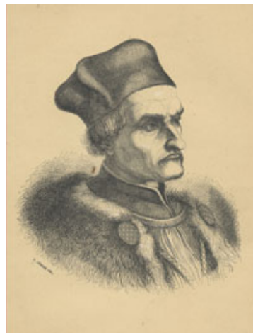
Geiler de Kaysersberg

Mais il y a certainement d'autres éléments qui ont favorisé l'installation précoce du protestantisme à Strasbourg. D'abord la ville était anticléricale pour une raison très simple: c'est qu'elle s'était débarrassée de l'emprise du prince-évêque de Strasbourg depuis fort longtemps, depuis 1262 pour être précis, lorsque l'armée de la ville avait battu celle de l'évêque. Et comme elle continuait à se méfier de lui elle demandait à tout nouvel évêque, qui résidait d'ailleurs habituellement à Saverne, de lui jurer obédience. Ensuite elle a toujours soutenu l'Empereur contre le Pape lorsque les deux s'entre-déchiraient. C'est également la ville qui a nommé comme prédicateur à la Cathédrale le fameux Geiler de Kaysersberg qui n'a cessé de fulminer contre les mauvais prêtres, les évêques et les moines, les accusant de luxure et d'avarice.