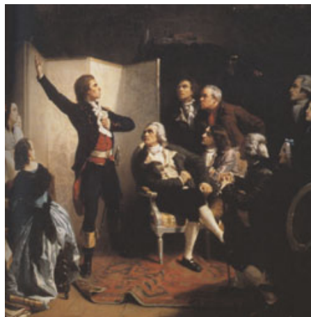
Rouget de Lisle chantant pour la première fois la Marseillaise devant Frédéric de Dietrich

Schneider y entre et prend bientôt la tête des Jacobins, alors que Dietrich est plutôt modéré, Feuillant, et opposé à la mort du Roi. Bientôt Schneider et les autres Jacobins vont créer un club à part, Schneider va publier un journal, l' Argos et Dietrich va être destitué (septembre 1792). Schneider sera encore commissaire municipal de Haguenau (un espèce de maire) puis en février 1793 va être nommé accusateur public. Dès le mois de mars il obtient trois condamnations à mort (des jeunes paysans) et reçoit de Paris une guillotine qui servira pour la première fois sur ce qui est aujourd'hui la place Kléber le 31 mars 1793. Mais c'est seulement au mois d'août que la guillotine sera installée de manière permanente sur la fameuse place. Auparavant Schneider parade à travers toute la ville avec un détachement à cheval et la guillotine sur roues! Les citoyens strasbourgeois n'aiment pas cela du tout et pendant la nuit démolissent la guillotine et en jettent les débris contre la porte de sa maison (il habite tout près dans la rue qui s'appelle aujourd'hui rue de la Nuée bleue). C'est ainsi qu'il se fait de nombreux ennemis dont le nouveau maire Monet, un autre Jacobin pourtant, mais un Savoyard, et puis d'autres encore parmi les nombreuses sections révolutionnaires de la ville (ce qui va lui coûter la vie quelques mois plus tard). En octobre 1793 il obtient enfin la création d'un tribunal révolutionnaire à Strasbourg dont il est l'accusateur public.