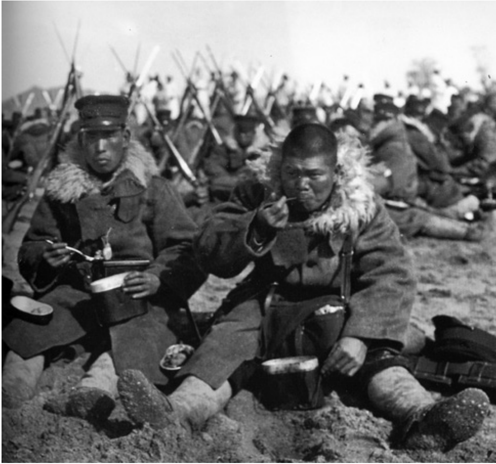
soldats japonais fatigués