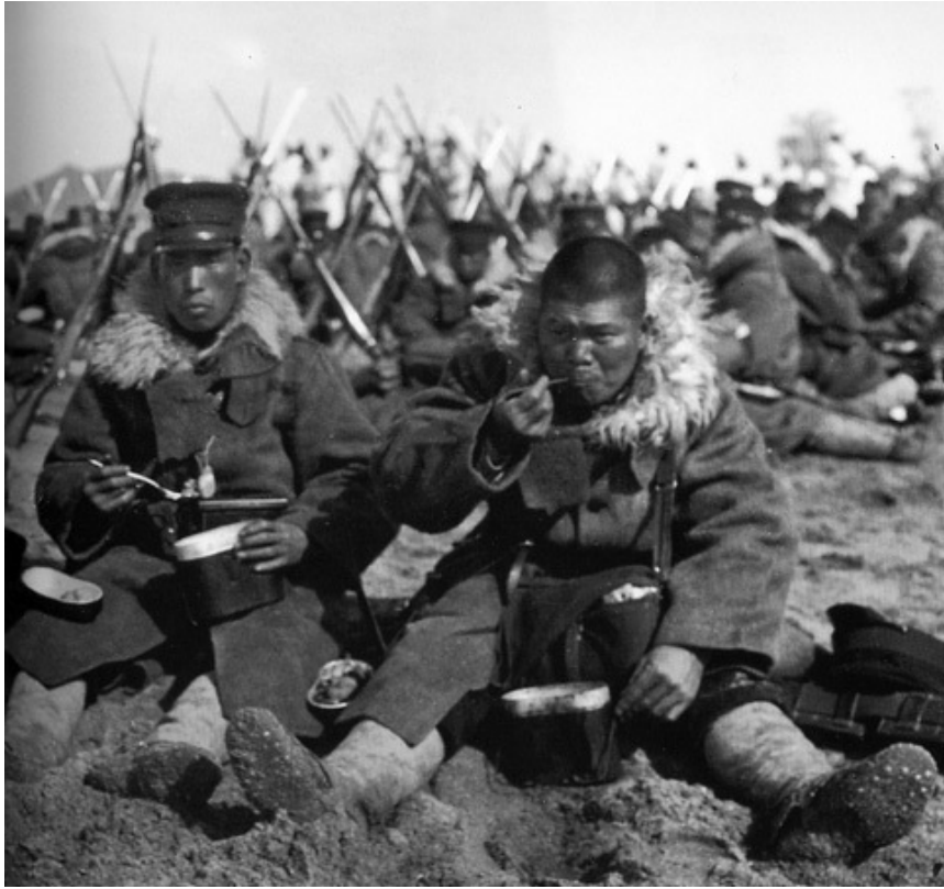
soldats japonais fatigués