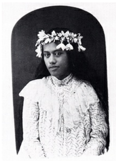
L'épouse maorie de Segalen