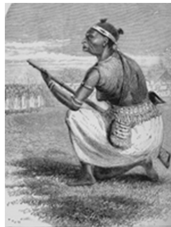
Une Amazone du Roi du Dahomey. Je me demande si vous l'imaginiez ainsi?

Burton dénombre 2500 Amazones mais note qu'elles n'ont rien à voir avec les Amazones de l'Antiquité. Les Coutumes sont des cérémonies religieuses pendant lesquelles on met à mort les prisonniers de guerre et les criminels. Aux seules Coutumes annuelles on immole chaque année 500 victimes auxquelles on confie des messages pour les ancêtres. La coutume est ancienne, note-t-il, «et très assidûment perpétuée par un clergé puissant dont c'est l'intérêt de veiller au respect de la tradition». Burton est écoeuré. «La cruauté semble être chez l'Africain une nécessaire manière d'être, et ce qui lui procure ses plus grands plaisirs, c'est de faire souffrir et d'infliger la mort. Ses rites religieux sont toujours gratuitement sanglants.» «Le Royaume de Dahomé est un mélange d'horreurs et d'inhumanité.»