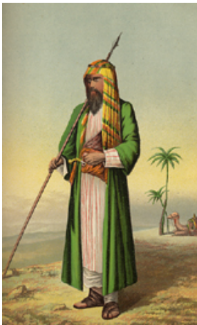
Pèlerinage à La Mecque: Burton déguisé en Mirza Abdullah

De là il va entreprendre à nouveau plusieurs expéditions: une au Gabon pour étudier nos cousins les Gorilles dont on ne sait pas grand'chose à l'époque, une autre chez les Fang célèbres pour leur cannibalisme et deux autres chez le plus sanguinaire de tous les souverains de l'Afrique, le Roi du Dahomey (voir n° 1561-62 A Mission to Gelele, King of Dahome, with notices of the so-called Amazons, the Grand Customs, the Yearly Customs, the human sacrifices, the present state of the slave trade, and the negro's place in nature, by Captain Sir Richard F. Burton, edited by his wife Isabel Burton, memorial Edition, Tylston and Edwards, Londres, 1893).