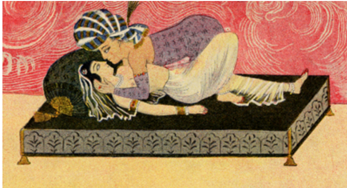
Le Clément n'a point créé de spectacle plus beau que deux amants sur la couche (Dr. Mardrus)

«Je quitte ce jardin en emportant dans mon coeur, comme la tulipe sanglante, la blessure de l'amour. Le malheureux est celui qui sort du jardin du monde sans avoir emporté la moindre fleur dans le pan de sa robe.»