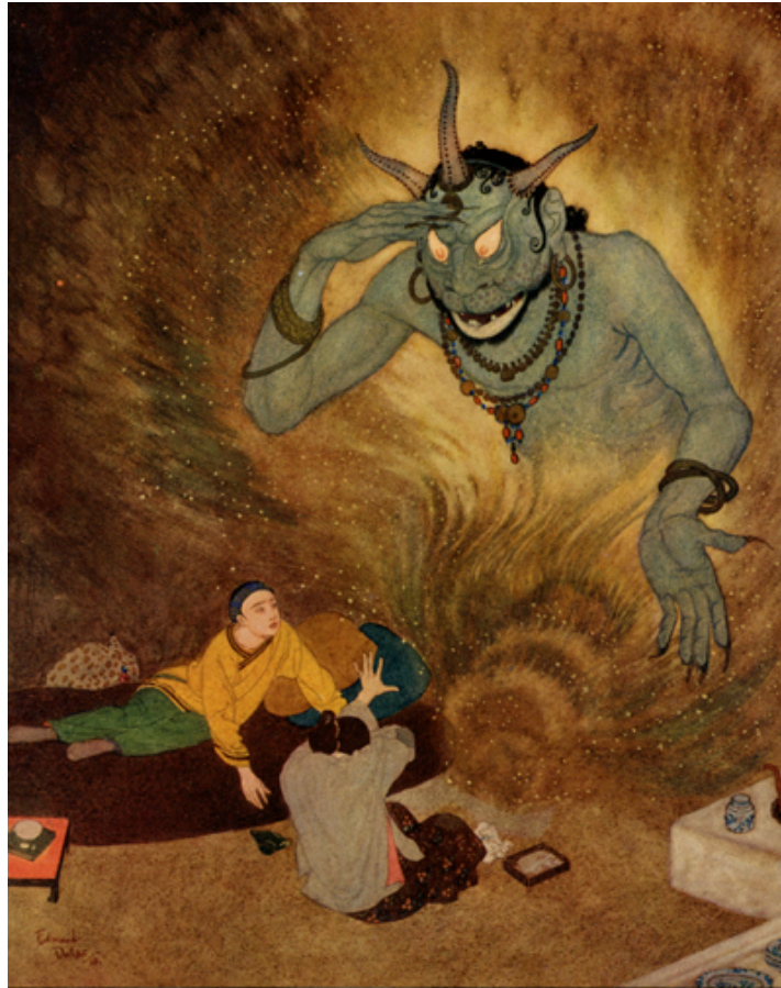
Edmund Dulac: Le Génie de la Lampe