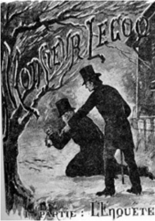
Monsieur Lecoq - L'enquête