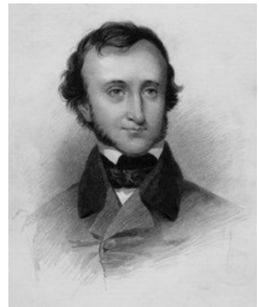
Edgar Allan Poe

Pour ceux que l'histoire du roman policier intéresse je rappelle qu'Edgar Allan Poe a publié trois nouvelles mettant en scène le fameux Chevalier Dupin (entre 1841 et 43): La Lettre volée , Double Assassinat dans la Rue Morgue et Le Mystère de Marie Roget (les titres français, différents des titres anglais, sont de Baudelaire qui les a traduits avec un enthousiasme délirant). Tout le monde se souvient des deux premières, moi en particulier car j'ai toujours eu du mal à digérer la réflexion du Sieur Dupin sur la supériorité du Jeu de Dames sur les Echecs pour démontrer l'intelligence de quelqu'un, le premier jeu n'étant pas encombré par des règles compliquées et des pions aux caractéristiques toutes différentes, ce qui accapare trop l'attention. Alors qu'au jeu de dames, plus simple,