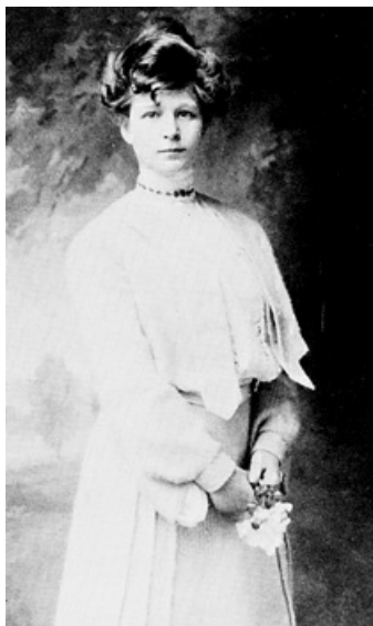
Frieda von Richthofen

Salome, Isadora Duncan, etc. On pourrait y ajouter la Femme imaginée par Wedekind : la Lulu de la Büchse der Pandora (j'en parle à propos de Karl Kraus, toujours dans Vienne, capitale de la Cacanie ). Rien à voir avec ce qui se passe en Angleterre à la même époque.